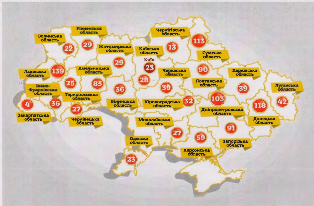
Охопленість Проектом регіонів України впродовж 2018-2019 н.р.