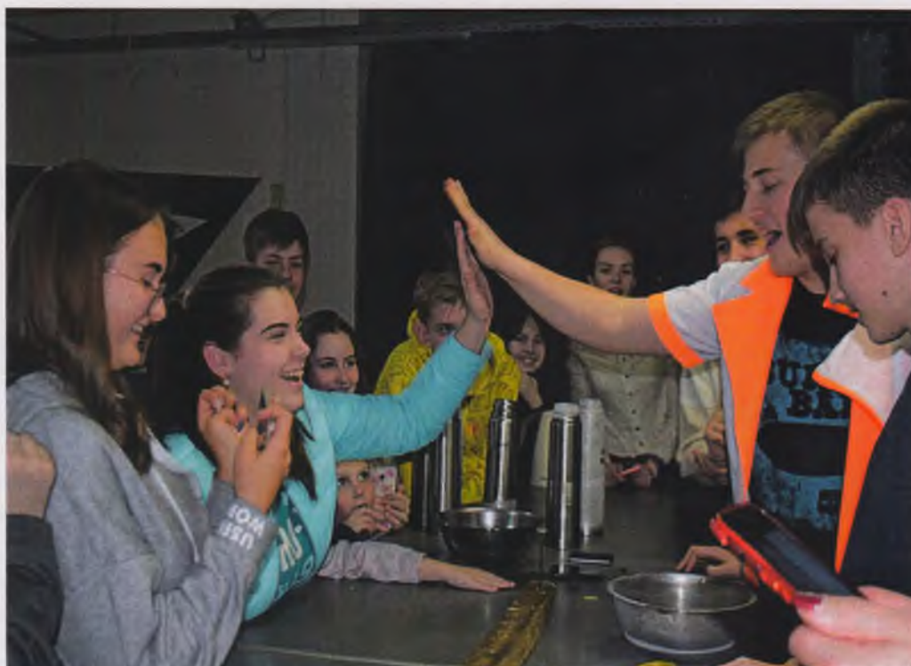
Учасники міжрегіональних класів 2018-2019 н.р.

«Родзинкою» Проекту у 2018-2019 н.р. було створення 20 команд міжрегіональних класів із різних куточків України, учні яких брали участь у цікавих тренінгах, виїзних екскурсіях, різноманітних заходах, разом відпочивали біля моря. Така новація спрямована на налагодження партнерських відносин між вчителями та формування ефективних учнівських команд міжрегіональних класів. Тобто Проект не лише навчає, але й об'єднує!